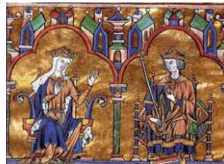
Blanche de Castille et son fils Louis IX. Psautier de saint Louis, Manuscrit, latin 10525. BNF. Vers 1274.

Étudier l'art du Moyen-Âge, c'est traverser les portes du temps. L'art médiéval est multiple, foisonnant et passionnant.